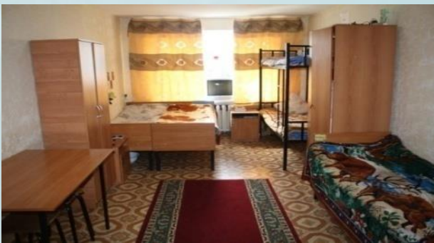
Жатақхана – 200 жатын-орын