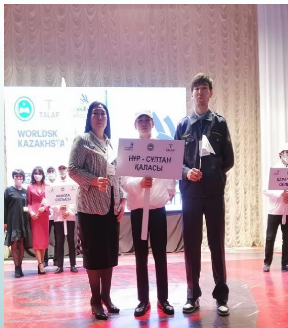
Wordskills 2021 г.Ақтобе