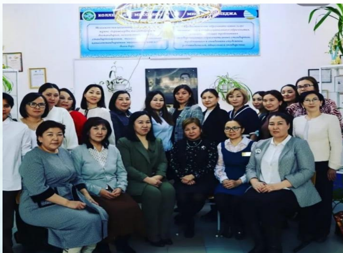
Городской семинар - тренинг по воспитательной работе