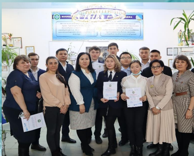
Научно-практическая конференция с участием социальных партнеров