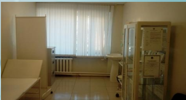
Медпункт – 29,9м 2