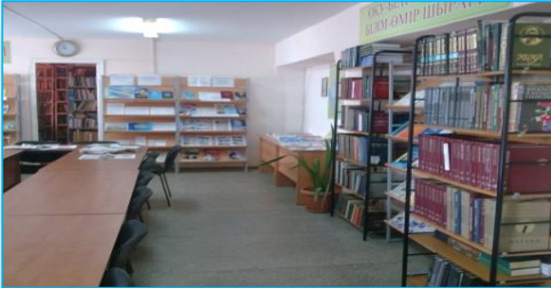
Кітапханада кітап қоры – 77 662 экз. Жалпы көлемі – 62,3м 2 , орын саны – 20

Оқу кабинеттерінің саны – 31, зертхана – 2, шеберхана – 4, компьютерлік класс – 4; спорт залы, акт залы – бар