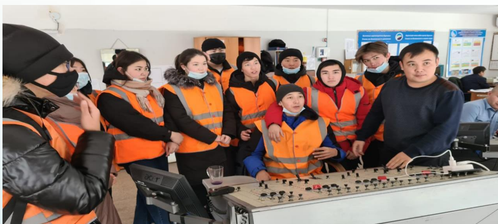
Студенты во время прохождения практики на станции Астана