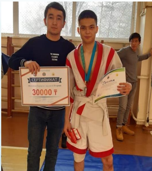
Соревнования «Қазақ күресі»

Студенты общежития активно участвуют в организации деятельности общежития, озеленения территории колледжа.