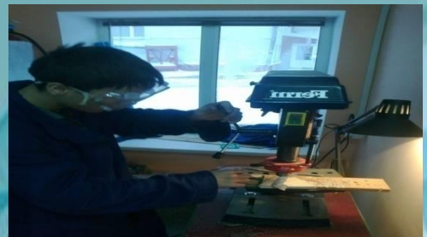
Электр дәнекерлеу шеберханасы