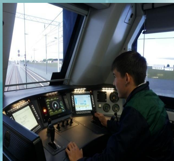
«Локомотив жөндеу депосы тренажер симулятор»