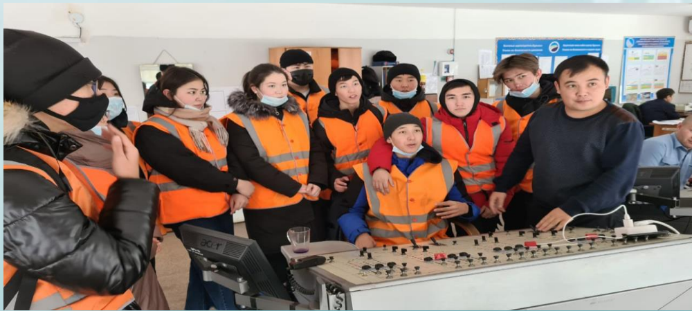
Станция Астанада студенттердің өндірістік тәжірибие өту сәті