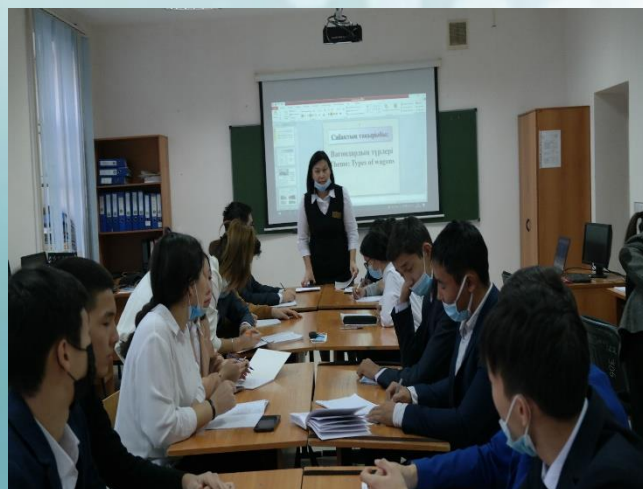
День открытых дверей - городской открытый урок преподавателей специальных дисциплин