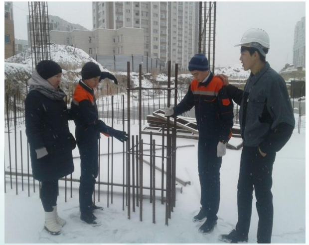
Студенттердің өндірістік тәжірибе өту сәті «Базис А»