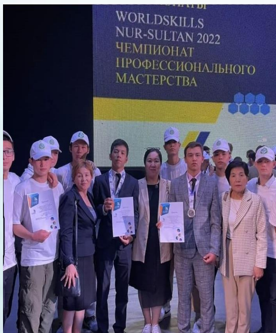
Worldskills 2022 Нұр-Сұлтан қ.