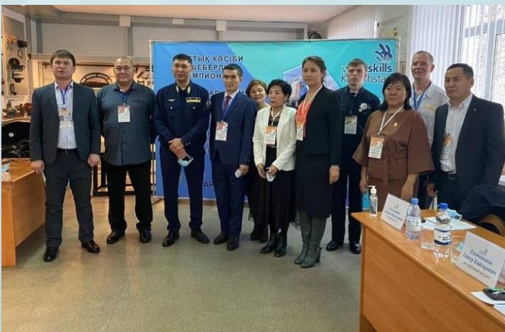
Национальный чемпионат профессионального мастерства Wordskills 2021 г. Павлодар

Ежегодно лучшие студенты колледжа имеют возможность на встречу с Президентом-Ректором Академии логистики и транспорта и экскурсии по городу Алматы.