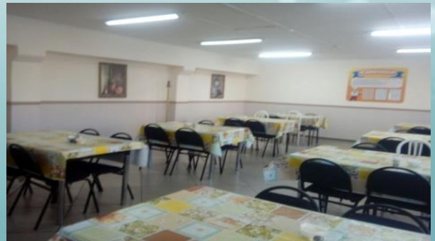
Асхана – 113,7 м 2 , 100 орын