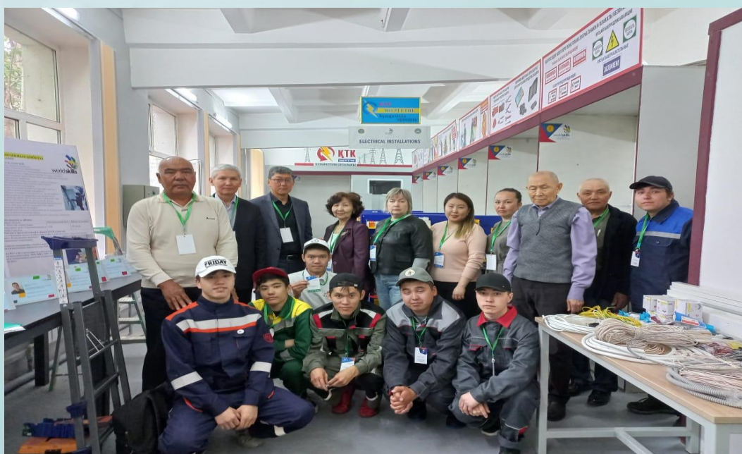
Worldskills 2022 г. Нұр-Сұлтан

Колледж үрдісінде негізгі бағыт-тәрбие студенттің өзін-өзі басқарудағы жетілдіру бойынша жұмыс болып табылады. Астана қаласының басқа да оқу орындарымен бірігіп Студенттік үкімет, жастар ісі жөніндегі қоғамдық бірлестіктерімен, орталықтардың салауатты өмір салтын қалыптастыру және үкіметтік емес ұйымдармен белсенді жұмыс жасайды. Колледж қызметінің ерекше назары студенттердің бос уақытын ұйымдастыруға арналады.