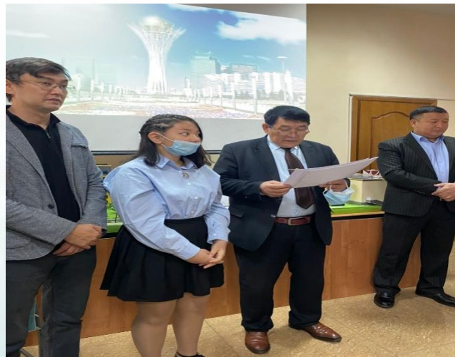
Гордской «Х Мұшайра жас ақындар сайысы»