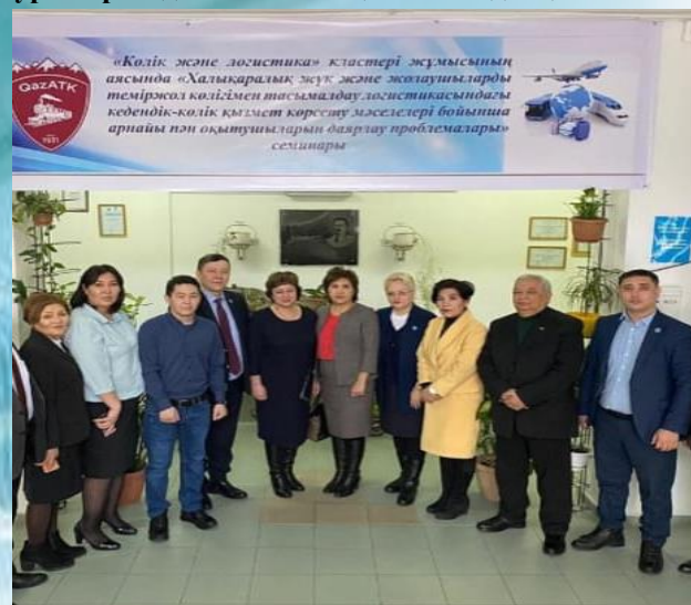
Городской семинар в рамках кластера «Транспорт и логистика»