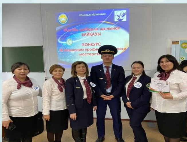
Қалалық кәсіби шеберлік конкурсы