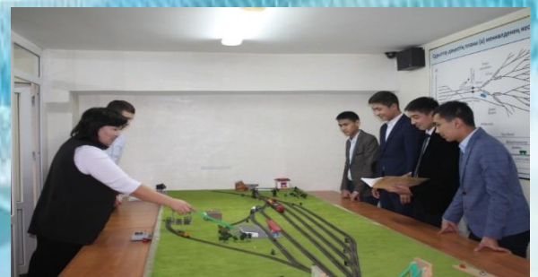
Тасымалдауды ұйымдастыру бойынша зертхана