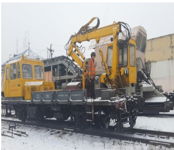
Студенты во время прохождения практики в АО «НК «ҚТЖ» «Астанинская дистанция пути»