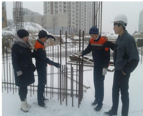
Студенты во время прохождения практики в «Базис А»